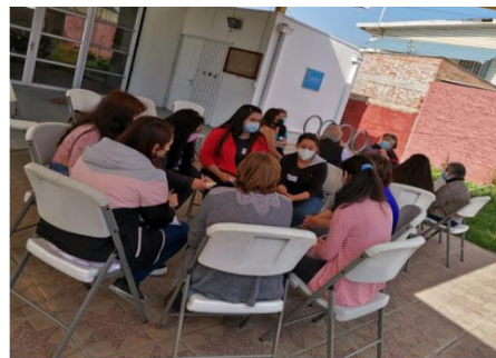
Hito. Familiarización y vinculación. Barrio Cuatro Álamos y Esquina Blanca