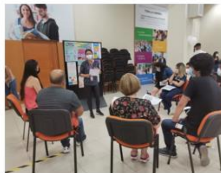
Feria de Proyectos. Hito Devolución a la comunidad