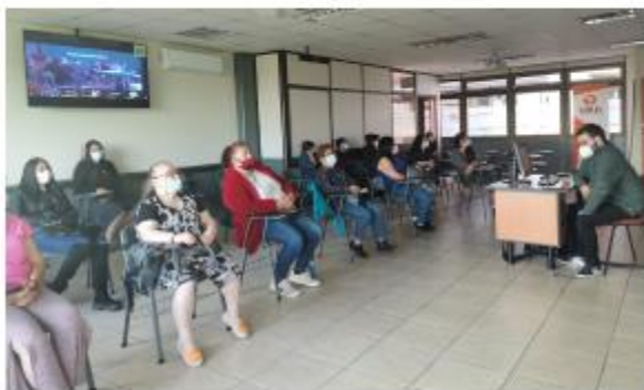
Vecinas y vecinos en Sala Híbrida, Campus Maipú.