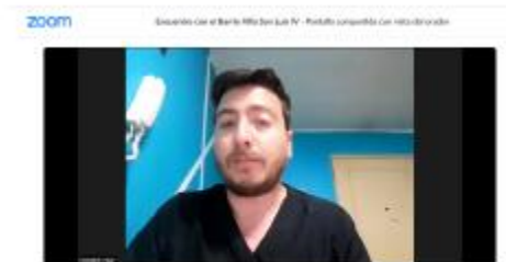
Participación de estudiantes en Conversatorio